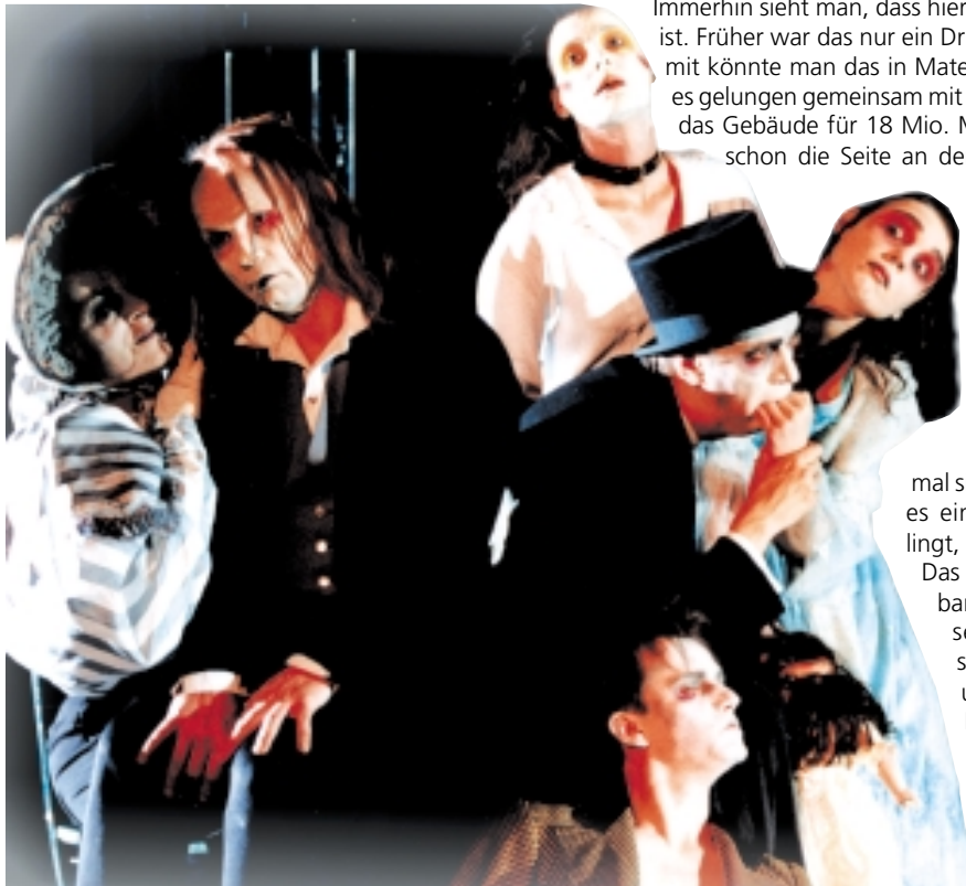
Aus der Inszenierung „Kaspar“ von Peter Handke